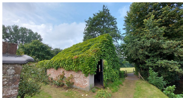
Moestuin-complex Huize Blijdorp in Voorschoten

De moestuincultuur stond in ons gebied op hoog niveau. Sommige producten, zoals ananas, werden zelfs als waardevol geschenk cadeau gedaan. Op veel buitenplaatsen zijn de moestuinen in onbruik geraakt of geheel verloren gegaan.