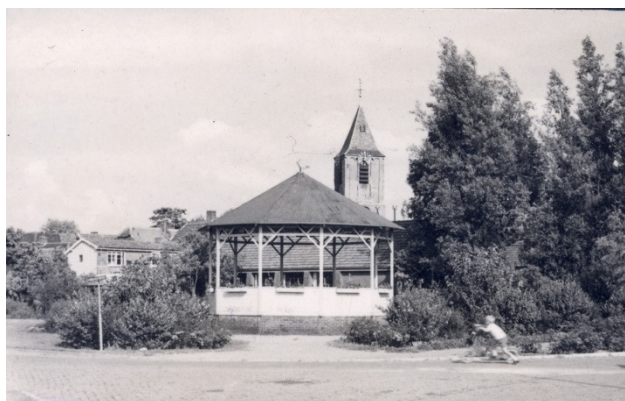
De muziektent in het Wilhelminaplantsen

In augustus 1949 ontving het bestuur een brief van de landelijke "Vereniging Oranjedag" met het verzoek om