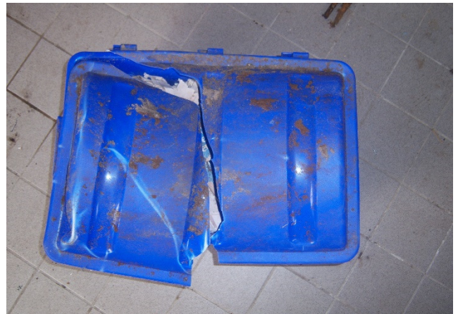
De beschadigde blauwe kist.

oproep gedaan om herinneringen in te sturen voor deze blauwe kist.