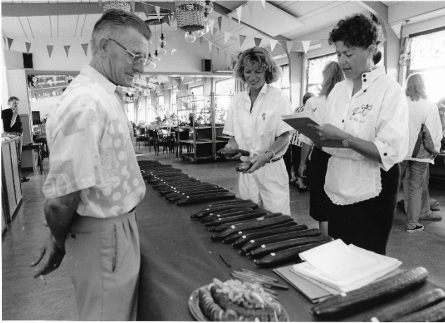
Komkommers sorteren tijdens de kermisweek in de bovenzaal van het Witte Paard aan de Koningin Julianastraat.

In de kassen vonden demonstraties plaats van grondstomen en spitten en tijdens een wedstrijd kon je proberen het aantal vierkante meters tuinbouwglas in Nootdorp te raden.