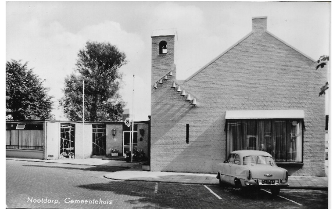
Het nieuwe Raadhuis van Nootdorp met Carillon.

plaats van zaterdag 31 augustus tot en met zaterdag 7 september.