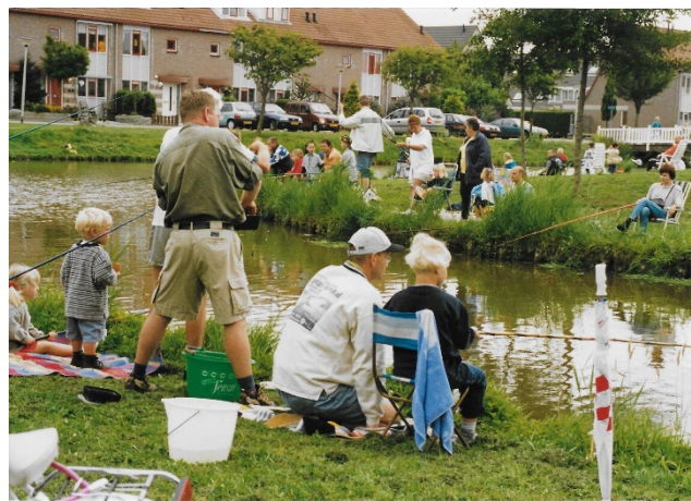
Sinds 1949 wordt er al een viswedstrijd georganiseerd

Elk jaar werd geëvalueerd welke activiteiten succes hadden en welke niet. Zo kon elk jaar het programma worden aangepast. In 1951 wordt gesproken over een gekostumeerde voetbalwedstrijd voor de jeugd t/m 16 jaar en komen termen als "tobbetje steken", "kopsabelen" en "kermis" voorbij. Van de Nootdorpse middenstand kwam het verzoek om geen