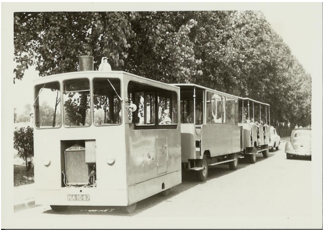
Treintje dat rondreed tijdens de Jaarmarkt 1969

Zo heeft het stadsarchief Rotterdam amateur fotografen gevraagd de stad te fotograferen om het tijdsbeeld vast te leggen. Daar bleek grote animo voor te zijn.