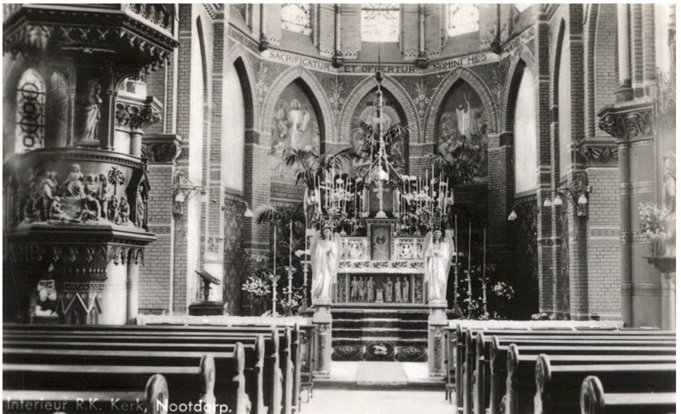
Interieur R.K. Kerk, Nootdorp.

Zuid-Holland is rijk aan religieus erfgoed uit diverse perioden, zoals kerkgebouwen, pastorieën, synagogen, moskeeën en begraafplaatsen. Bovendien herbergen religieuze gebouwen dikwijls waardevolle interieurs. Het platform zet zich in om dit bijzondere erfgoed te behouden. Verder wil men de zichtbaarheid en de toegankelijkheid van het religieus erfgoed verbeteren, de belangstelling vergroten en de deskundigheid bevorderen.