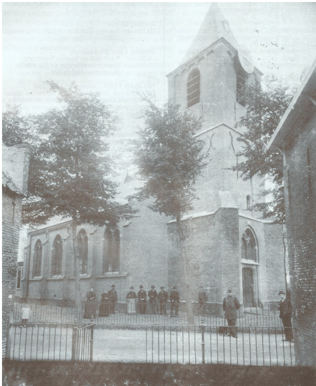
Een foto rond 1894, net na de grondige verbouwing, waarbij alleen de toren bleef staan. Let op de toren, slechts één wijzerplaat!

gerestaureerd, hier zijn heel wat stenen voor nodig. Het was een klus, maar we hebben berekend hoe veel dit er ongeveer zijn. In de toren gaan ongeveer 25.000 stenen. Deze stenen willen we verkopen, zodat de toren hersteld kan worden. En welke Nootdorper wil nu niet dat die toren blijft bestaan? Daarom doen we een beroep op alle Nootdorpers om