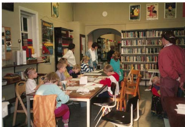
Kindermiddag in de Molenweg

Nieuwbouw kon om financiële redenen niet doorgaan, maar de School met de Bijbel aan de Molenweg kwam in 1976 vrij en dat leek een prima ruimte voor de eerstkomende tien jaar. In 1977 besloot de Gemeenteraad tot aanpassing van de school met de belofte dat begin jaren 80 nieuwbouw zou volgen, want volgens de toenmalige plannen zou de school moeten worden afgebroken. Dit is echter nooit gebeurd; nu staat hij propvol met spullen van de Kringloopwinkel en heeft de school een monumenten status. Het wijkgebouw aan de Kerkweg is inmiddels wel afgebroken en vervangen door een appartementengebouw.