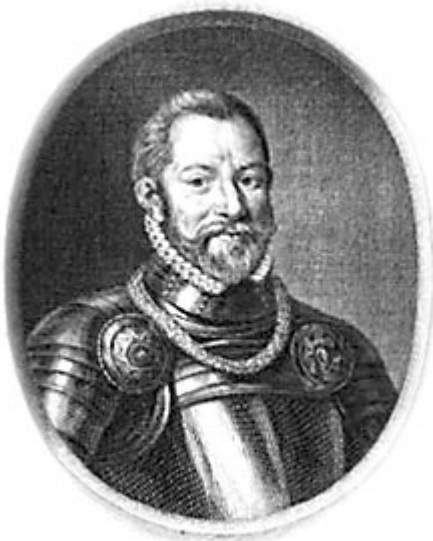
Geuzen- admiraal Lodewijk van Boisot

Nootdorp en Zoetermeer lagen aan de basis van het ontzet van Leiden op 3 oktober 1574. Op 10 september van dat jaar hadden de Watergeuzen, de stoottroepen van Oranje onder leiding van de Zuid-Nederlandse admiraal Lodewijk van Boisot ( Louis de Boissot ), de landscheiding boven Nootdorp, tussen Wilsveen en Zoetermeer bereikt. Ze stonden nog geen kilometer vanaf het dorp Zoetermeer.