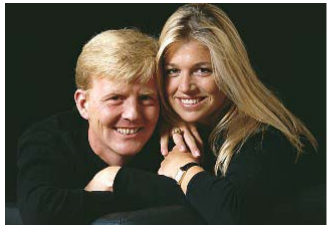
Willem-Alexander en Máxima: toekomstige bezoekers aan Nootdorp?!

De volgende bezoeken aan ons dorp waren minder vrolijk, het waren namelijk de uitvaartstoeten van prins Claus, prinses Juliana en van prins Bernhard die via Ypenburg naar Delft gingen. Deze stoeten trokken veel bekijks en het was erg indrukwekkend om de mooie lijkkoets met eerst prins Claus, later prinses Juliana en de affuit met prins Bernhard voorbij te zien trekken. Het wachten is nu op iets leukers bijvoorbeeld een bezoek van Willem Alexander en Máxima aan ons dorp.