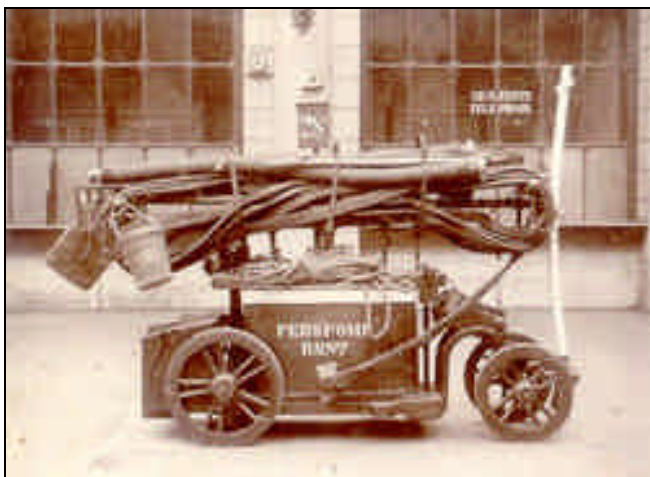
Stadsbrandspuitmaker Abram de Gever van Rotterdam leverde de spuit. Een van koper met 125

Branden kwamen vaak in de dorpen voor, ook in Nootdorp. Ze werden veelal veroorzaakt door roekeloosheid. Later wordt geklaagd over de arbeiders, die achter het dorp om, in hun schouwtjes kwamen varen van de turfakkers en veenlanden. Zij vervoerden op hun scheepjes "aschpotten" met "ongereekend vuur". Een groot gevaar voor de huizen met rieten daken. Per publikatie met "klokkeslag" werd bekend gemaakt, dat overtreders zouden worden beboet. Bij eerste overtreding 6 stuivers, bij tweede 12 stuivers enz. Men ging verlangen naar een goede brandspuit. Men haalde met een intekenlijst bij de inwoners ruim 900 gulden op.