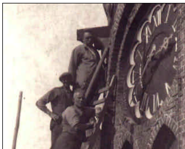
De renovatie van de Bartholomeuskerk in 1938.