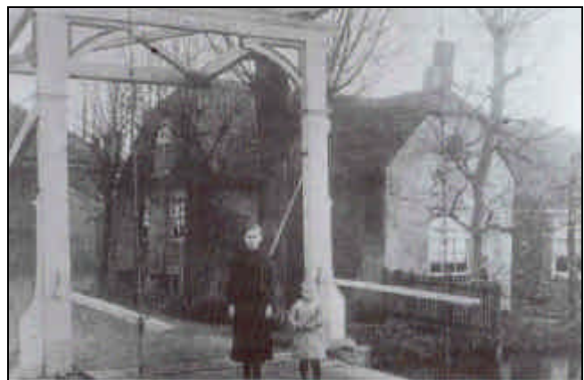
Boerderij aan de Dwarskade, foto ca. 1918. De boerderij is afgebroken in 1956.

Opmerking: niet alle huwelijken zijn vermeld in dit overzicht.